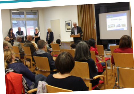
Cérémonie d'accueil des nouveaux arrivants