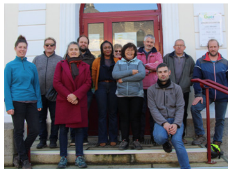
Photo consécutive au repas offert aux marchands ambulants par la Municipalité