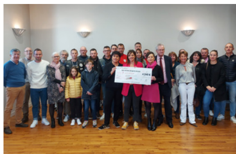
Remise du chèque Octobre Rose à l'association La Vannetaise (cf. p.7)