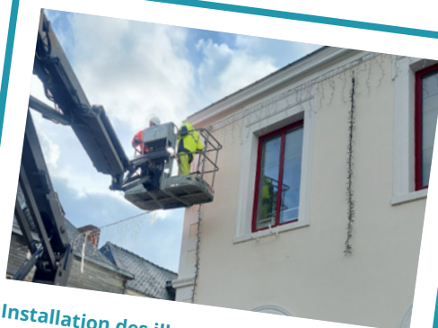
Installation des illuminations de Noël et arrivée d'un nouveau personnage place de l'Hôtel de Ville