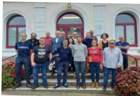
Repas avec les marchands ambulants à l'Hôtel de Ville