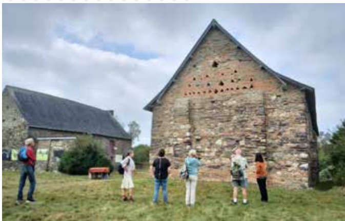
Présentation de la Chapelle St-Etienne lors des randonnées guidées des journées du Patrimoine

Les journées européennes du patrimoine sont l'occasion chaque année de se retrouver en septembre, et de visiter les pépites de notre territoire le temps d'un week-end. Ces journées nationales nous offrent une belle visibilité et valorisation des monuments, sites et œuvres.