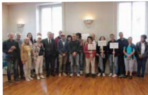
Cérémonie organisée à l'occasion du départ du périple à vélo Guer'Izon