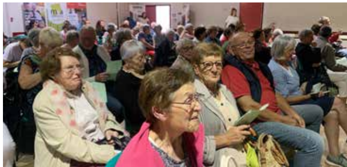
Les spectateurs guérois présents lors de la pièce de théâtre « Mme Reinette ».