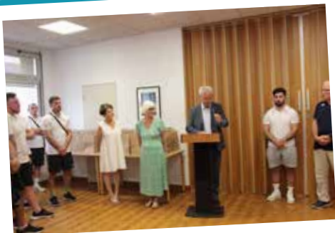
Accueil de la délégation Géorgienne lors de la Coupe du Monde de Rugby Militaire à l'Hôtel de Ville