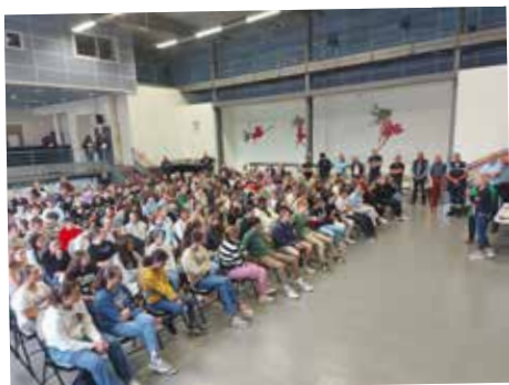
Réunion de prévention sécurité routière organisée par le Conseil des Sages à la salle La Gare