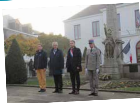
Cérémonie patriotique en mémoire de l'Armistice 1918, place de l'Hôtel de Ville