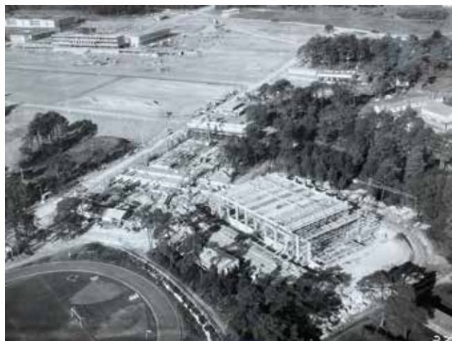
Création des infrastructures militaires et académiques : bâtiments de l'État Major, piscine, halle sportive en 1963

Lors de la 2 e Guerre mondiale , le camp s'internationalise. Il abrite des réfugiés espagnols en 1939 au château du Bois du Loup. En 1940 , une division polonaise s'y entraîne. Les Allemands s'y installent avec notamment un bataillon de char Tigre au printemps 1944, avant qu'il ne serve, la même année, aux Américains avant de devenir un camp de prisonniers allemands.