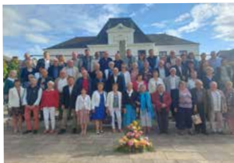
Réception à l'Hôtel de Ville en l'honneur des « classes 3 »