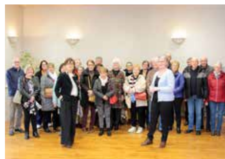
Cérémonie de remerciement des bénévoles de la Banque Alimentaire