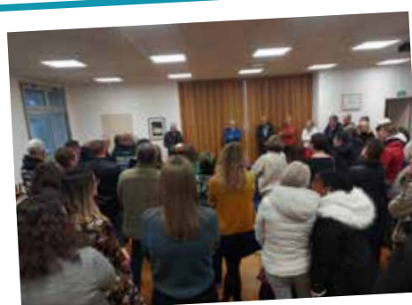
Cérémonie des vœux au personnel organisée à l'Hôtel de Ville