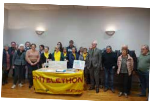
Cérémonie de remise du chèque Téléthon d'un montant de 10 705,70€