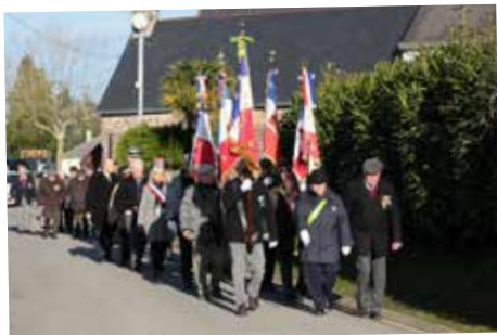
Cérémonie patriotique en hommage aux morts en AFN à Guer-St Raoul