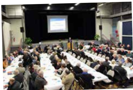
Cérémonie des vœux à la population et partage de la galette des rois à la salle La Gare