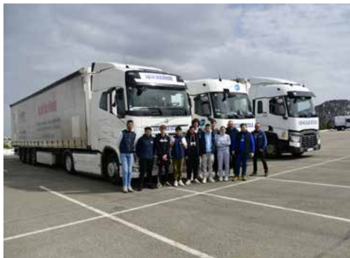
Pause au col de la Pierre St Martin (Pyrénées)

Quant aux filières professionnelles, la cité labellisée « lycée des métiers de la logistique et des transports », prépare aux bacs professionnels logistique, maintenance des véhicules poids lourds et véhicules légers, mais aussi à celui de conducteur de transports routiers de marchandises, et enfin au CAP de conducteur routier de marchandises. Ces formations peuvent conduire vers les BTS de logistique et transports associés ou Gestion de petites et moyennes entreprises ; et depuis la rentrée 2022, vers le BTS CIEL (Cyber Sécurité, informatique et réseaux, électronique et réseaux).