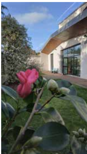
Camélia en fleur, jardin de la médiathèque, @mediatheque